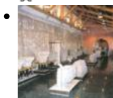
Antiquarium Epigráfico [3]